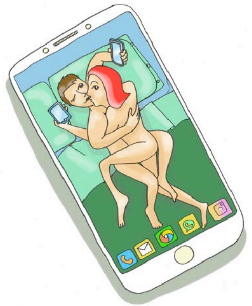
Disegno di Lucia LEPORE 1° Premio