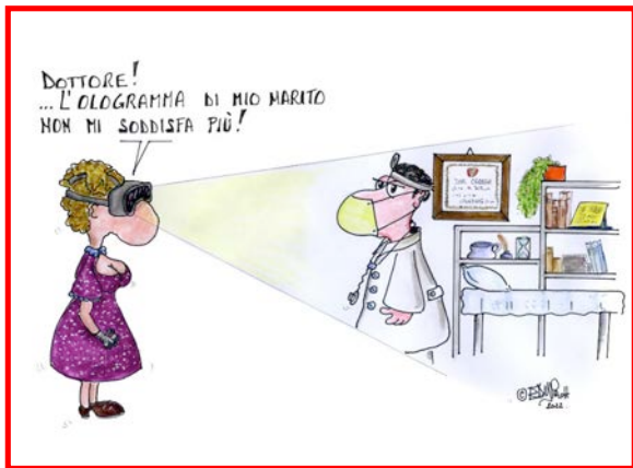
Disegno di PIERPAOLO PERAZZOLLI Premio Speciale Aldo Bortolotti