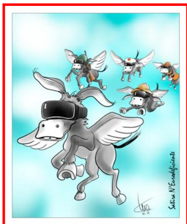
Disegno di Mario AIRAGHI 3° Premio