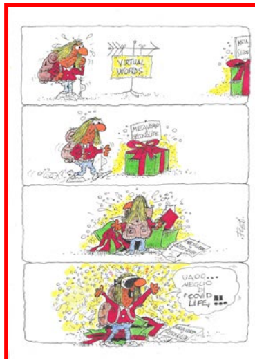
Disegno di Alfio LEOTTA (fleo) 2° Premio