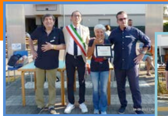
COMUNE DI CAVERNAGO