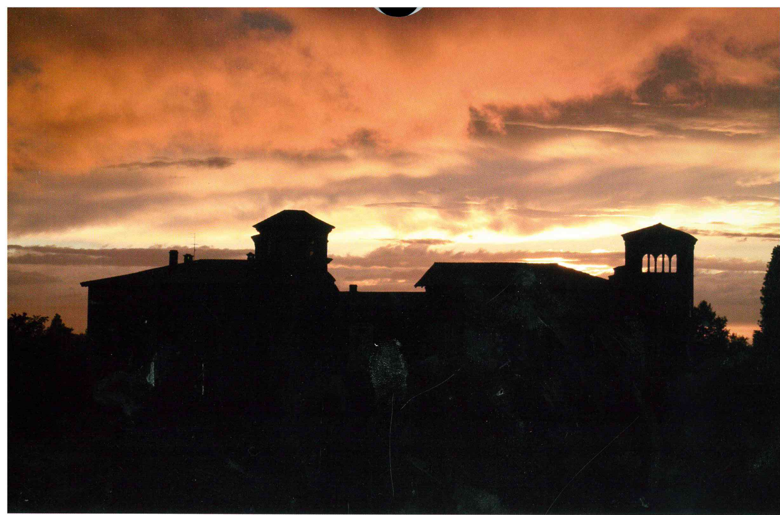
Angela Gaini "Rosso di sera bel tempo si spera"