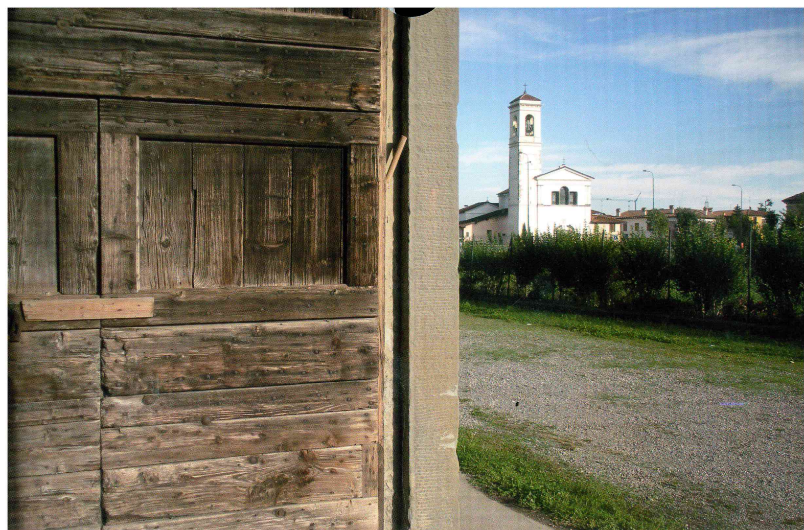
Luigi Pedrini "Affaccio"