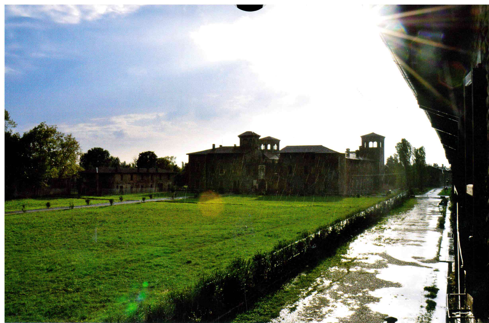
Aurora Invernici "Castello sotto la pioggia"