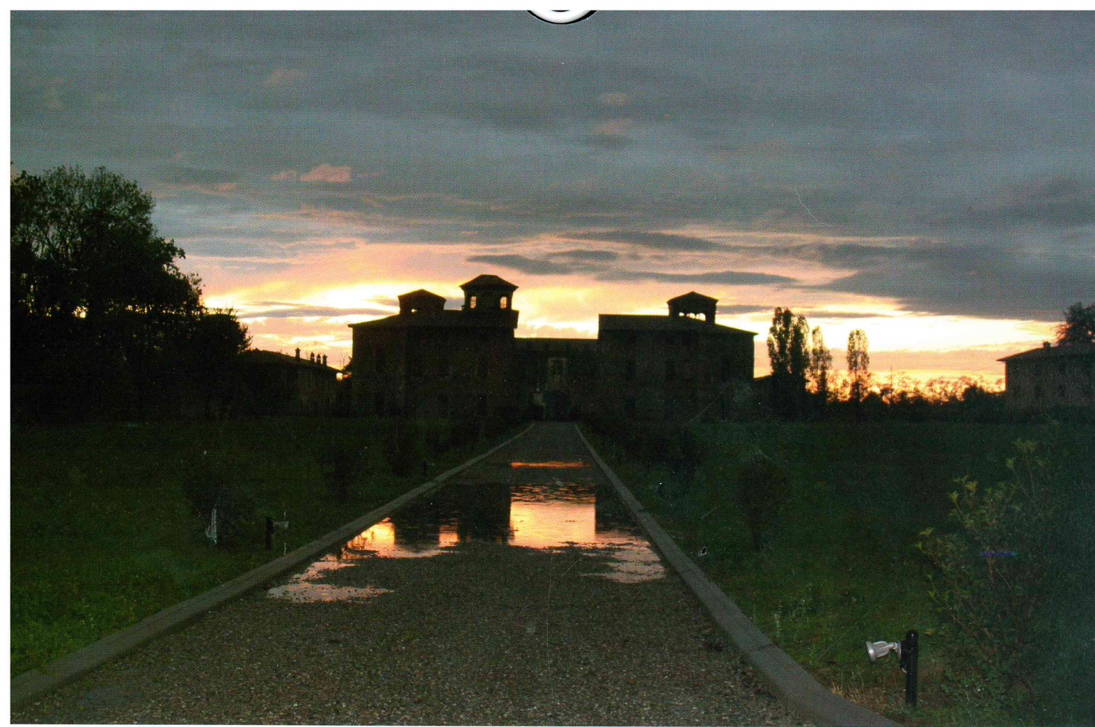
Paolo Gaiini "Riflessi al tramonto"