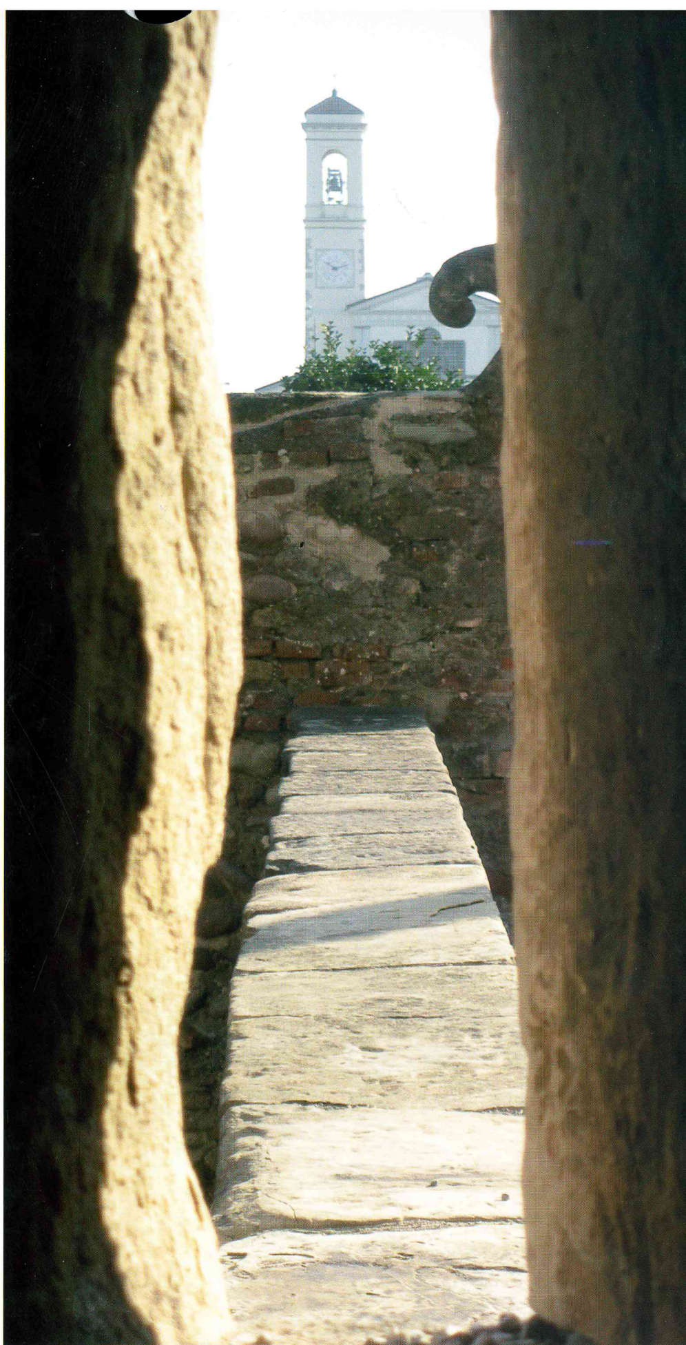
Giovanni Pedrini "Scorcio dalla feritoia"