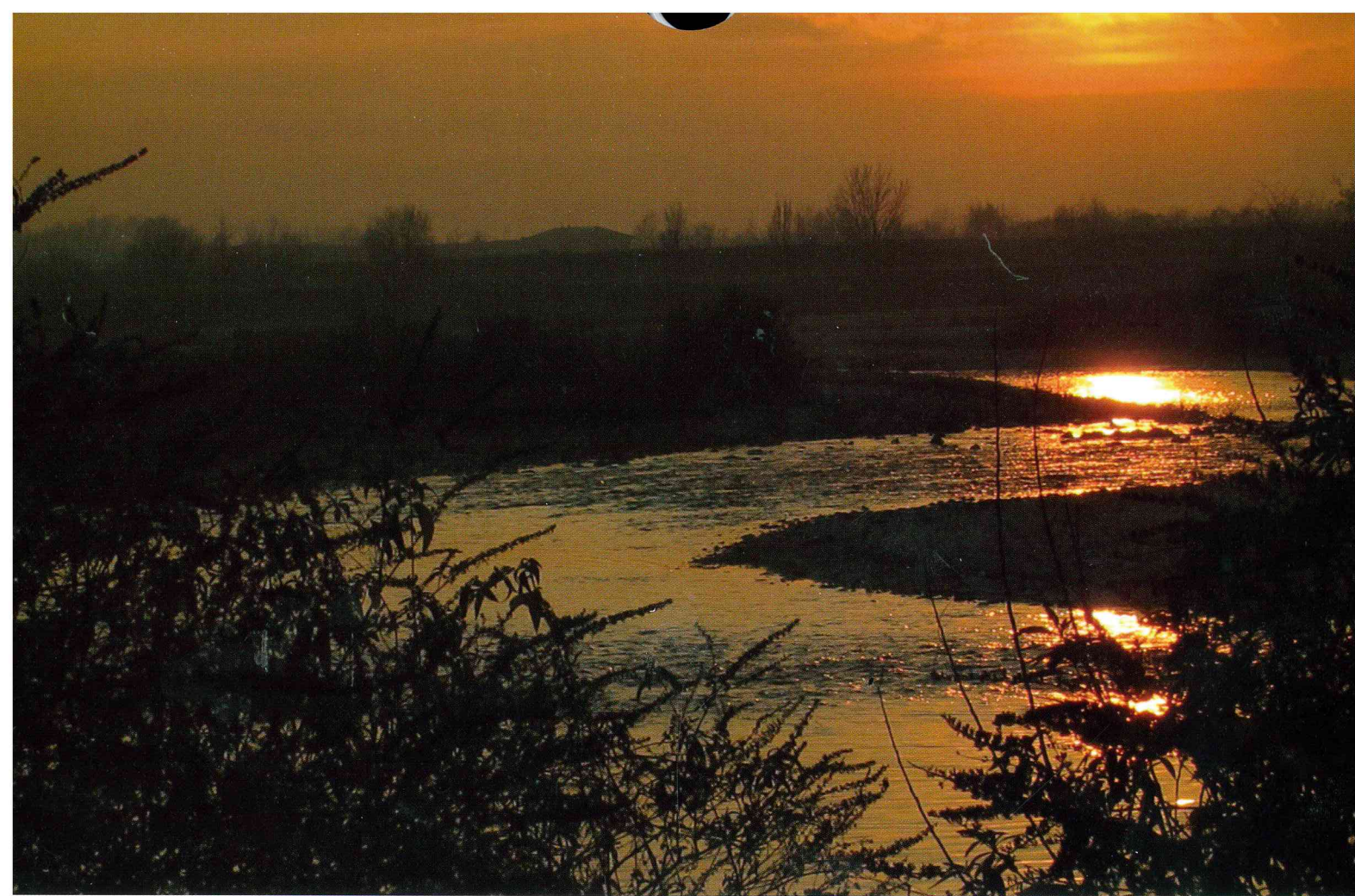
Pierbernardo Cortinovis "Tramonto sul Serio"