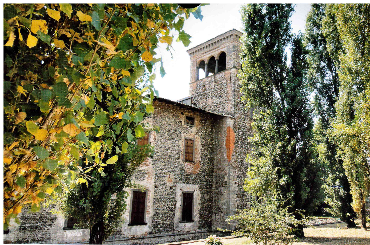
Fabio Tarengbi "L'arte tra la natura"