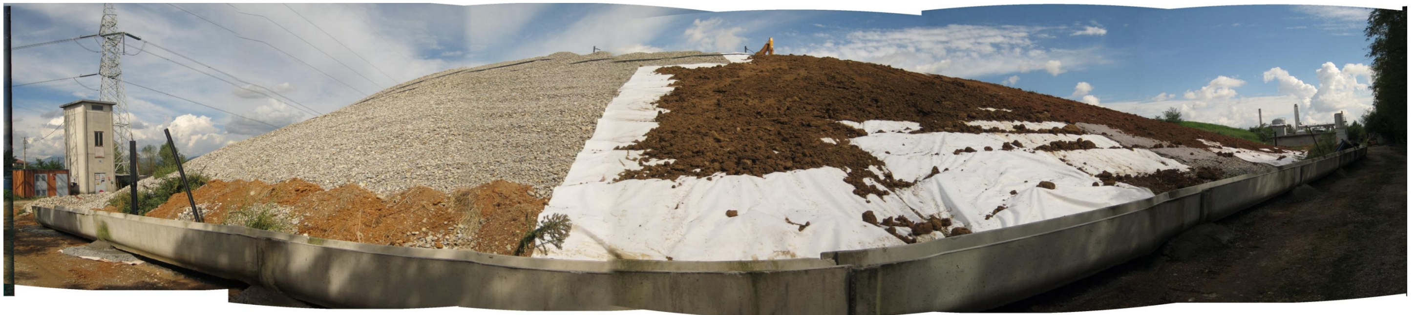
Fotografia 2. Discarica Bergamo Pulita di Cavernago. Vista del versante Ovest