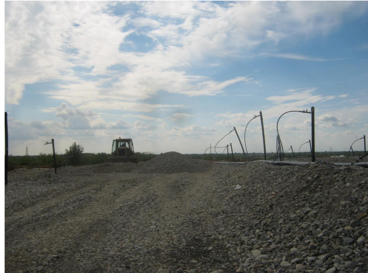
Fotografie 3, 4, 5, 6. Discarica Bergamo Pulita di Cavernago. Viste della sommità