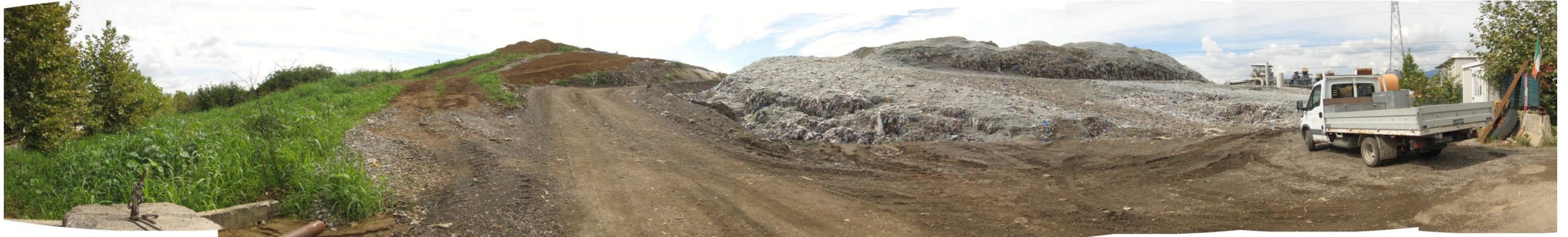
Fotografia 1. Discarica Bergamo Pulita di Cavernago. Vista ingresso lato Est, lotto in coltivazione