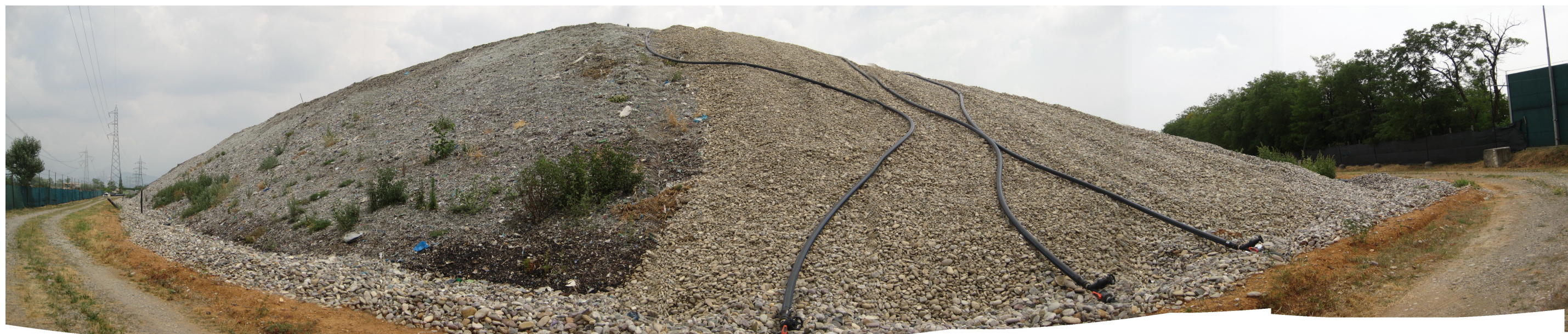
Discarica Bergamo Pulita di Cavernago. Vista scarpata N-Ovest in chiusura con rete raccolta biogas da nuovi pozzi, nelle stesse condizioni del sopralluogo precedente