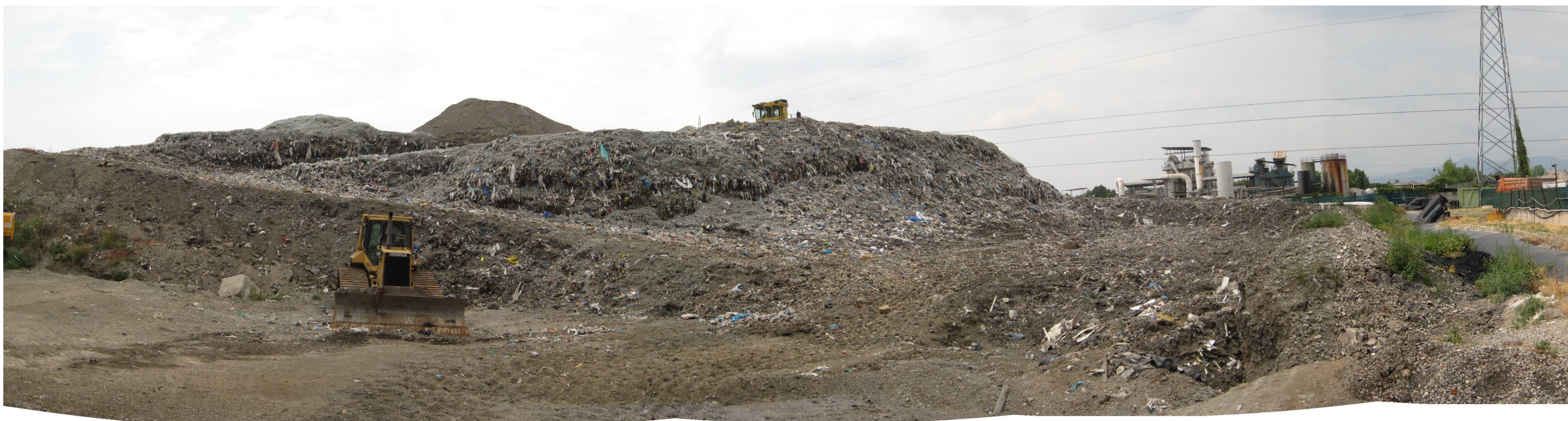
Discarica Bergamo Pulita di Cavernago. Vista del lotto in coltivazione