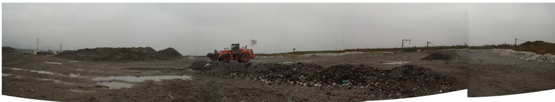
Fotografia 5: Piazzale di sommità verso est