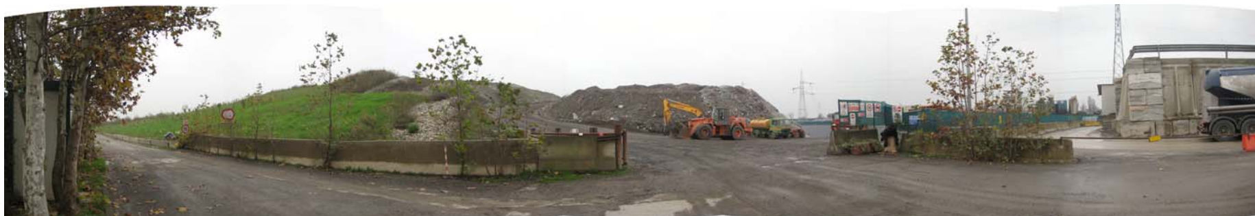
Fotografia 1: visuale della viabilità interna dall'accesso della discarica