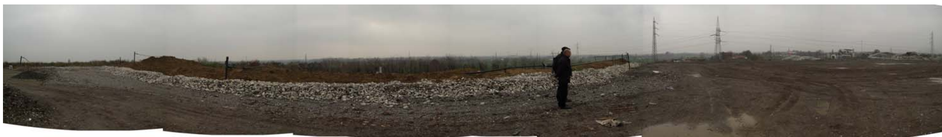
Fotografia 4: Piazzale di sommità verso Ovest