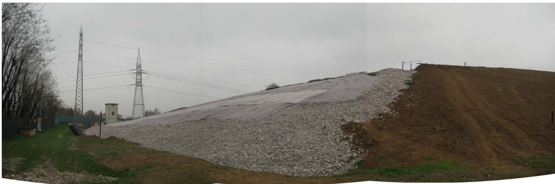
Fotografia 3: Stato del ripristino della scarpata Ovest