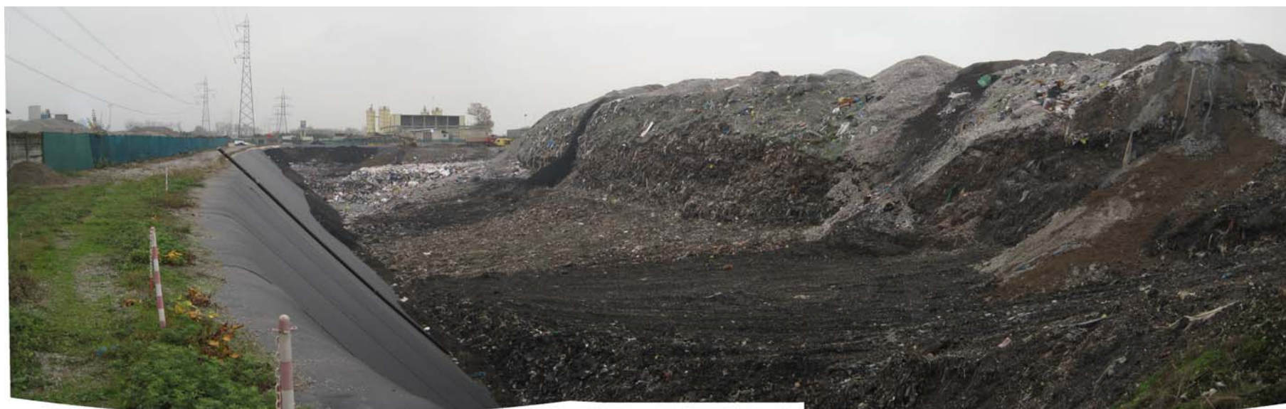
Fotografia 2: Volumetria disponibile al 27 novembre 2009