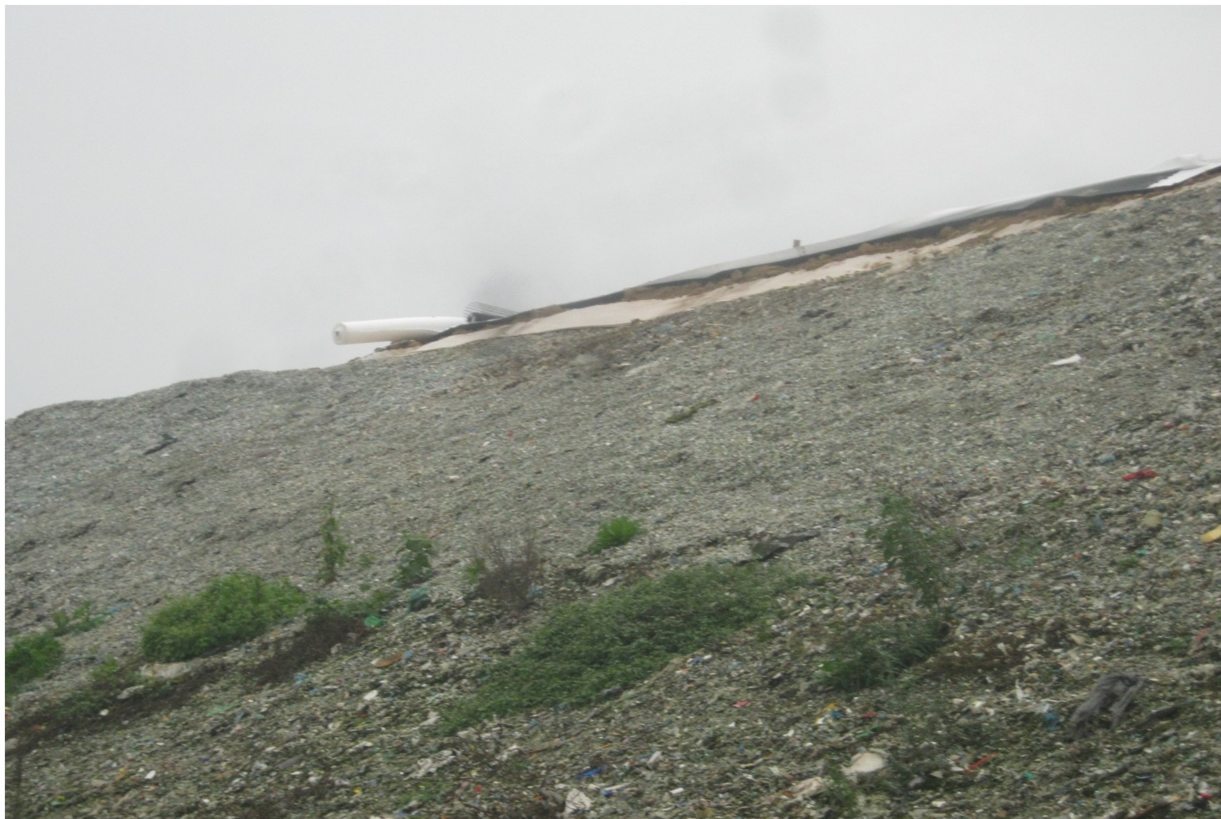
Fotografia 4. Discarica Bergamo Pulita di Cavernago. Vista degli strati di copertura della sommità del lotto in coltivazione