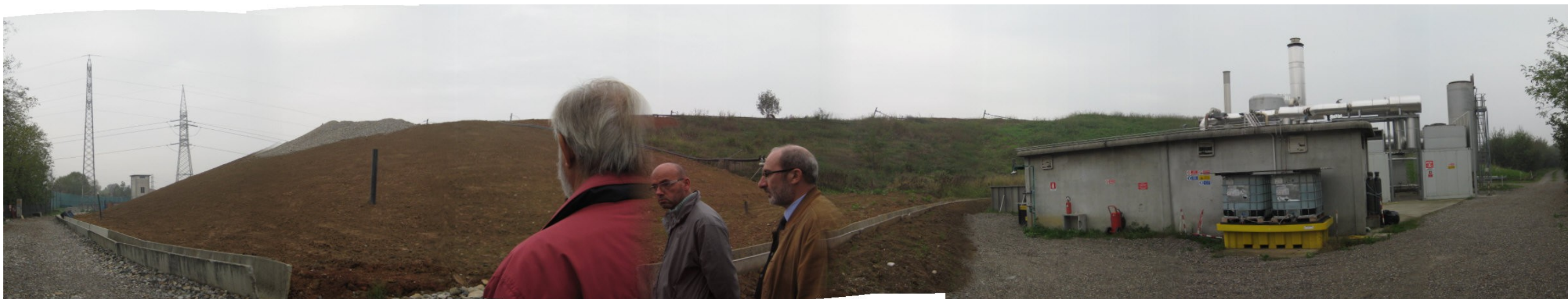
Fotografia 3. Discarica Bergamo Pulita di Cavernago. Vista del versante Ovest