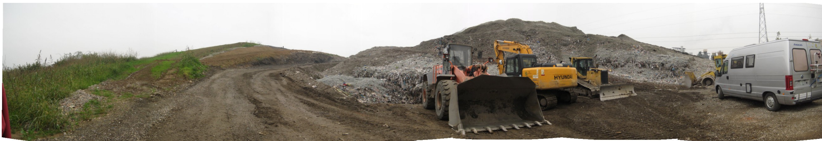
Fotografia 1. Discarica Bergamo Pulita di Cavernago. Vista ingresso lato Est