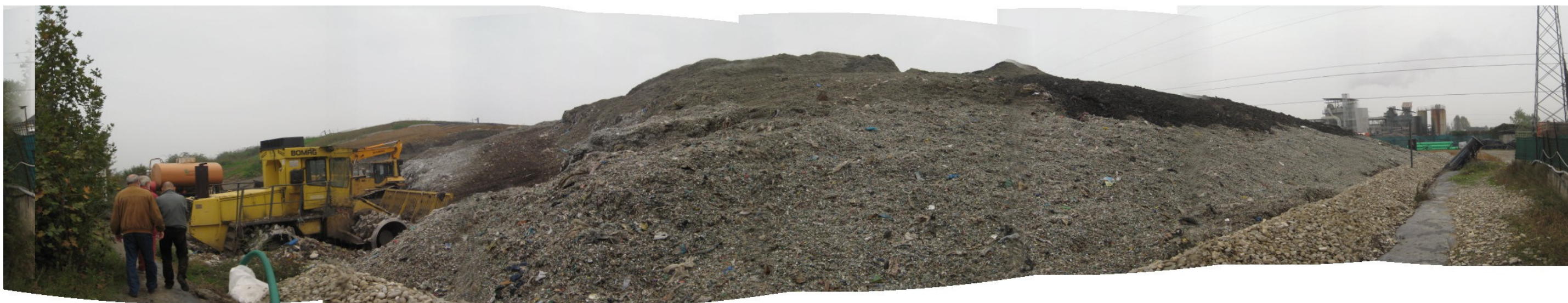
Fotografia 2. Discarica Bergamo Pulita di Cavernago. Vista ingresso lotto in coltivazione