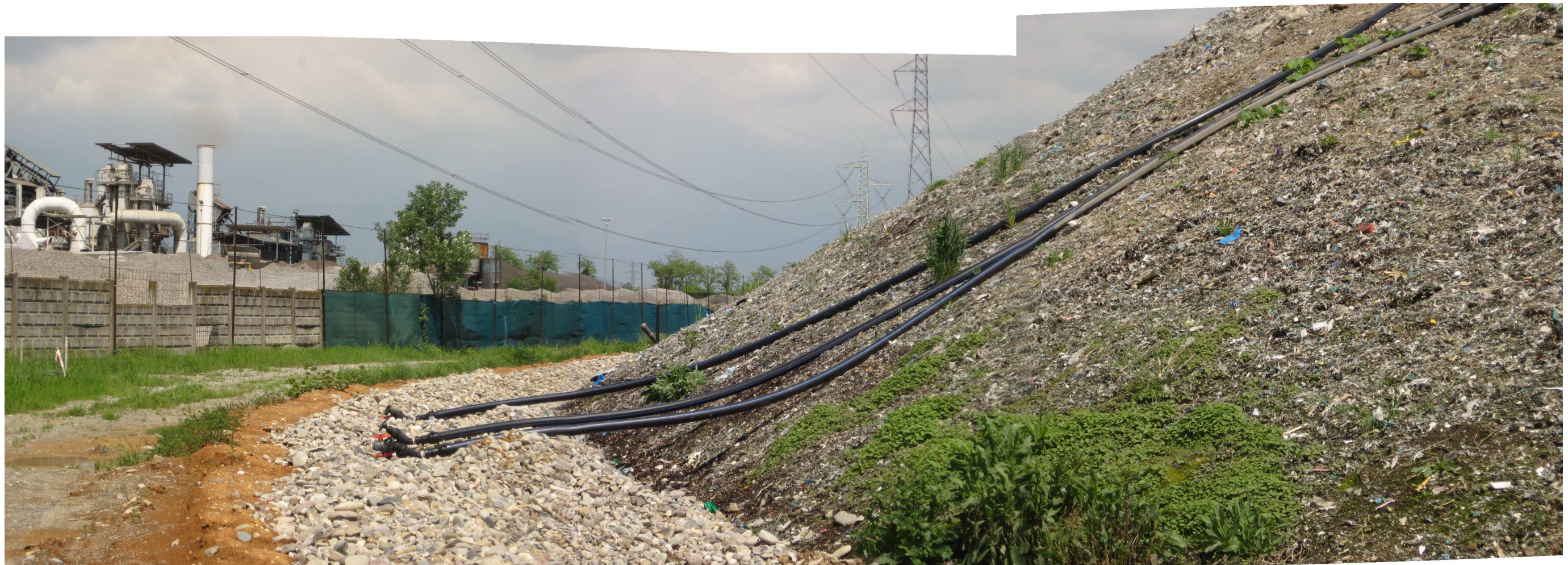
Discarica Bergamo Pulita di Cavernago. Vista rete raccolta biogas da nuovi pozzi