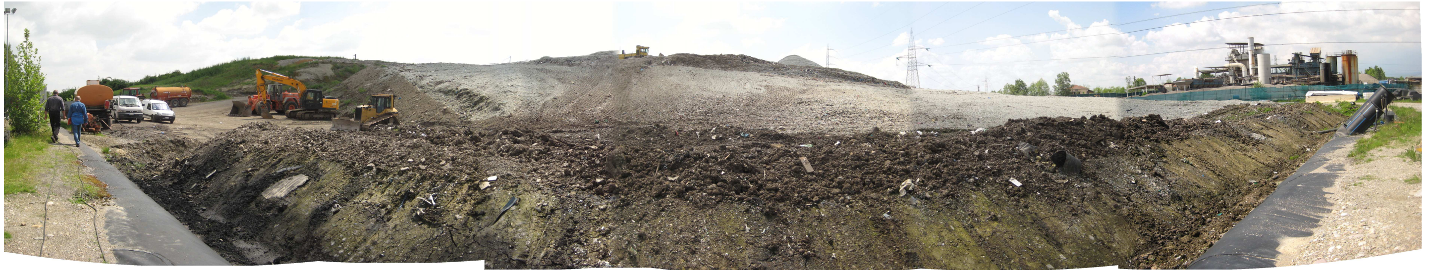
Discarica Bergamo Pulita di Cavernago. Vista del lotto in coltivazione