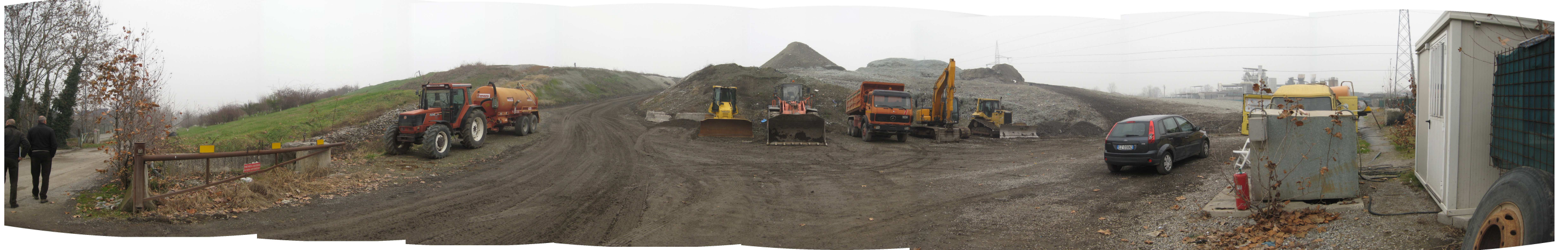
Figura 1. Vista del lotto in coltivazione