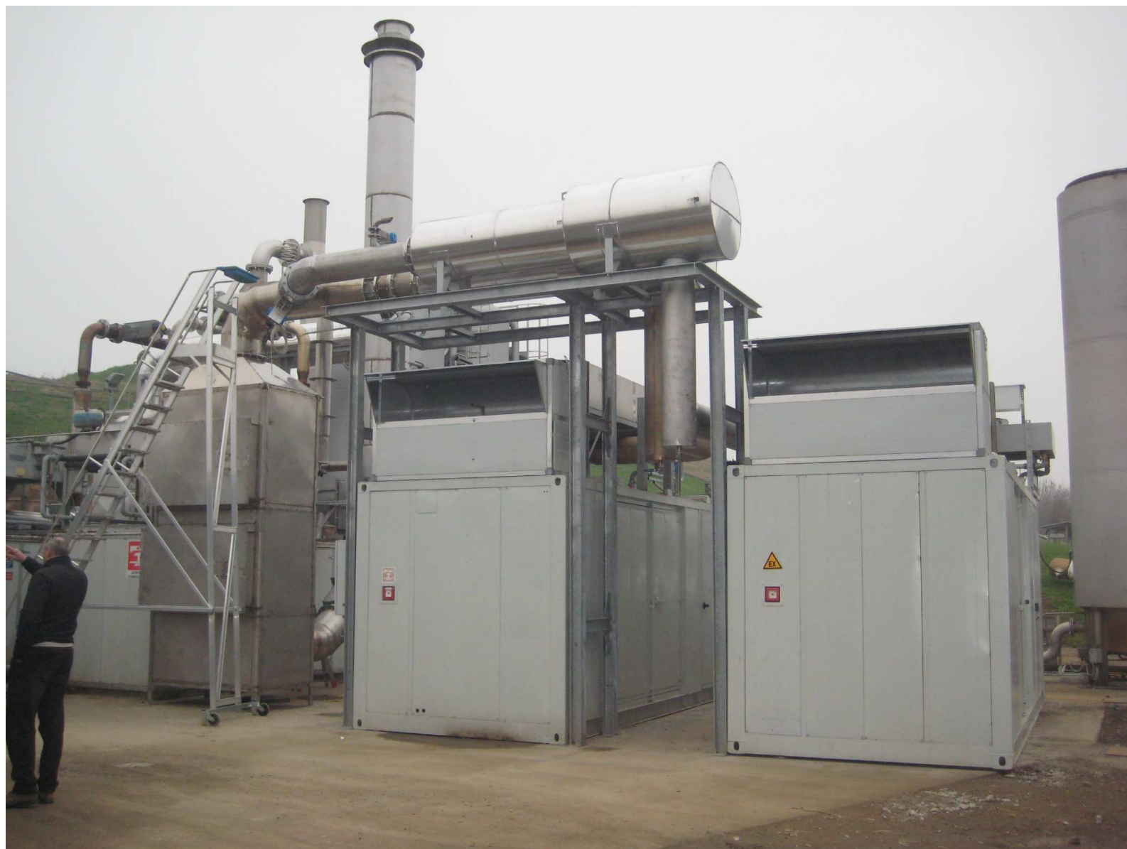
Figura 2. Vista dei due nuovi gruppi elettrogeneratori dell'impianto di generazione elettrica da biogas