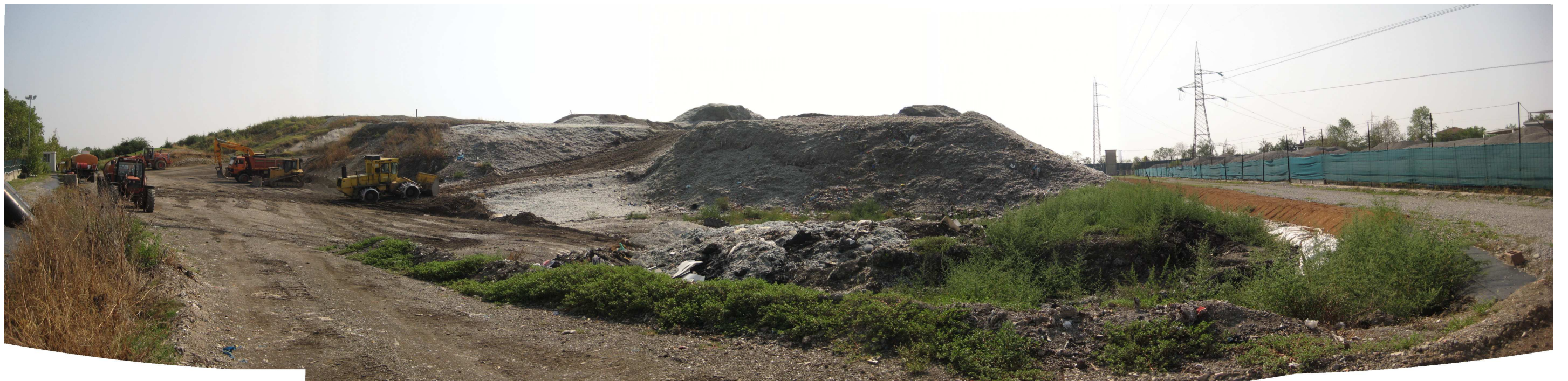
Figura 2. Vista del lotto in coltivazione