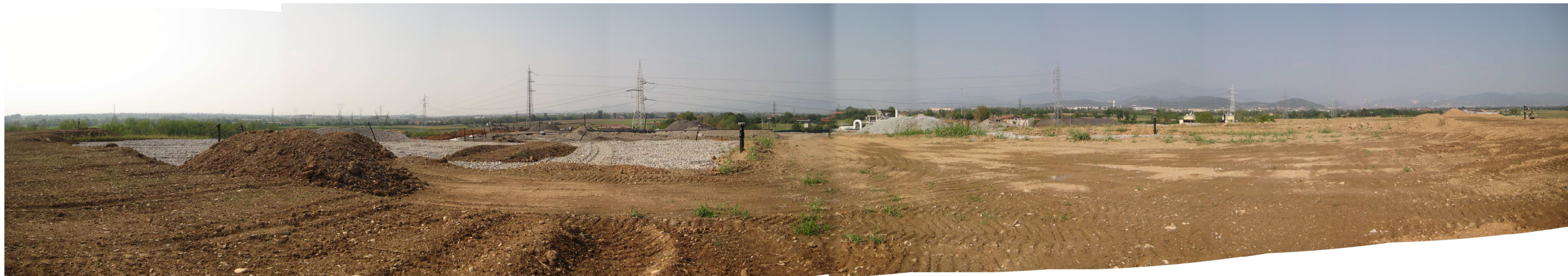
Figura 3. Vista della sommità, da sud verso Nord