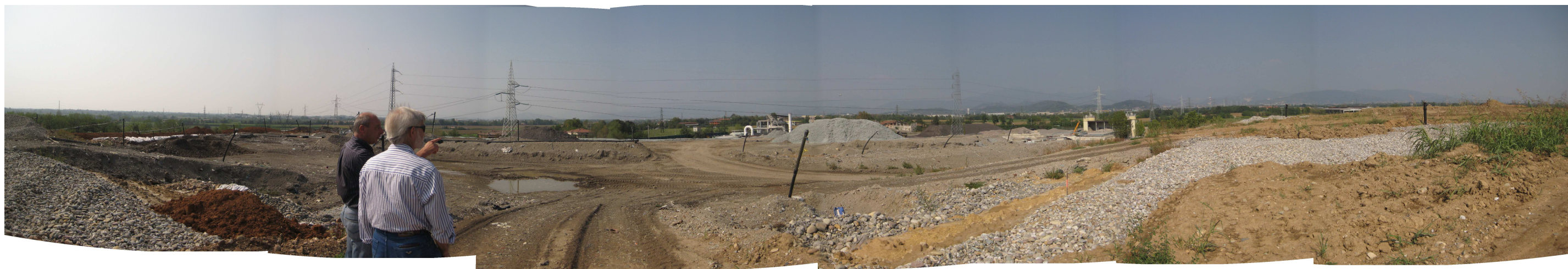
Figura 4. Vista del piazzale operativo in sommità.