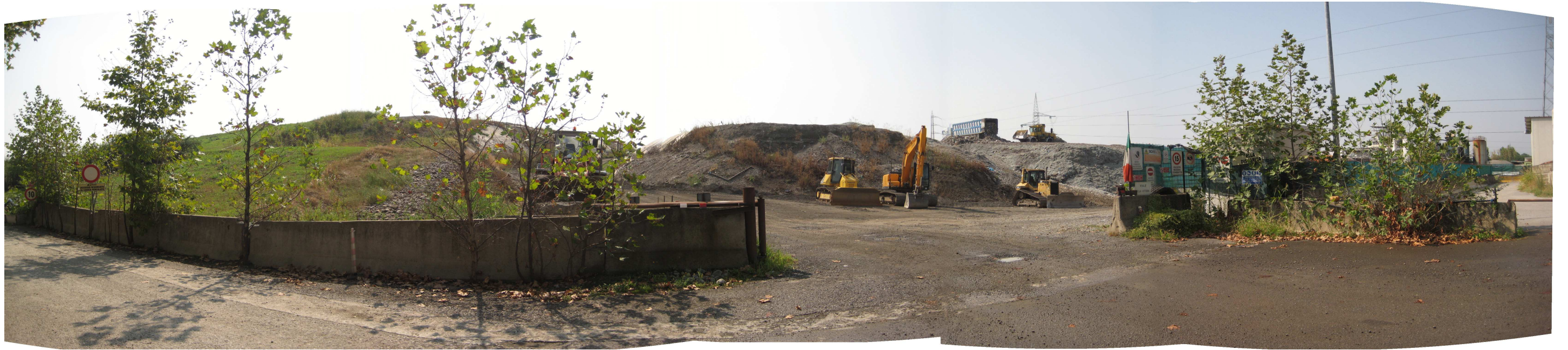
Figura 1. Vista dell'ingresso della discarica