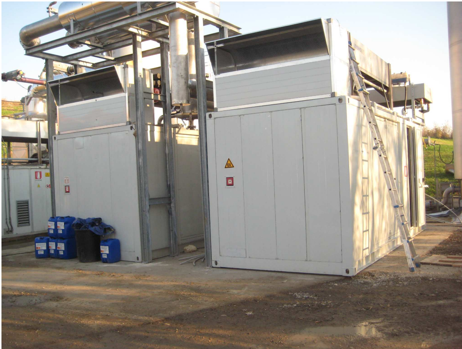
Figura 2. Vista dei due nuovi gruppi elettrogeneratori dell'impianto di generazione elettrica da biogas