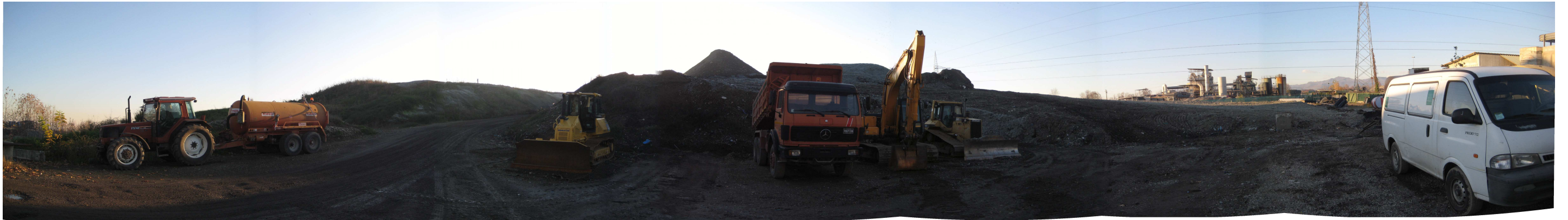
Figura 1. Vista del lotto in coltivazione