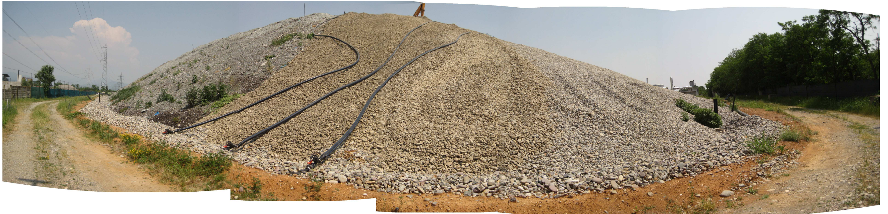
Discarica Bergamo Pulita di Cavernago. Vista scarpata N-Ovest in chiusura con rete raccolta biogas da nuovi pozzi