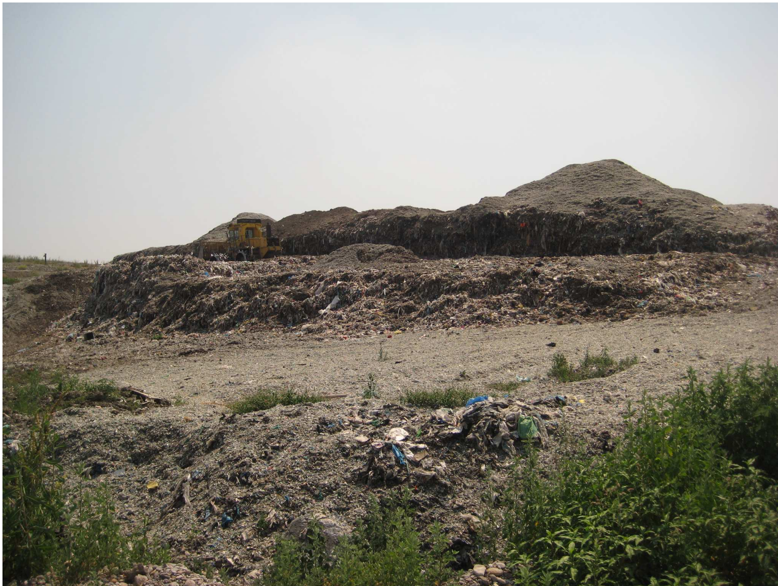
Discarica Bergamo Pulita di Cavernago. Vista del lotto in coltivazione