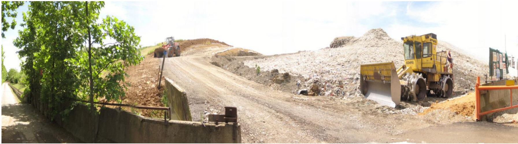
Fotografia 1. Vista ingresso discarica – Lotto 5A