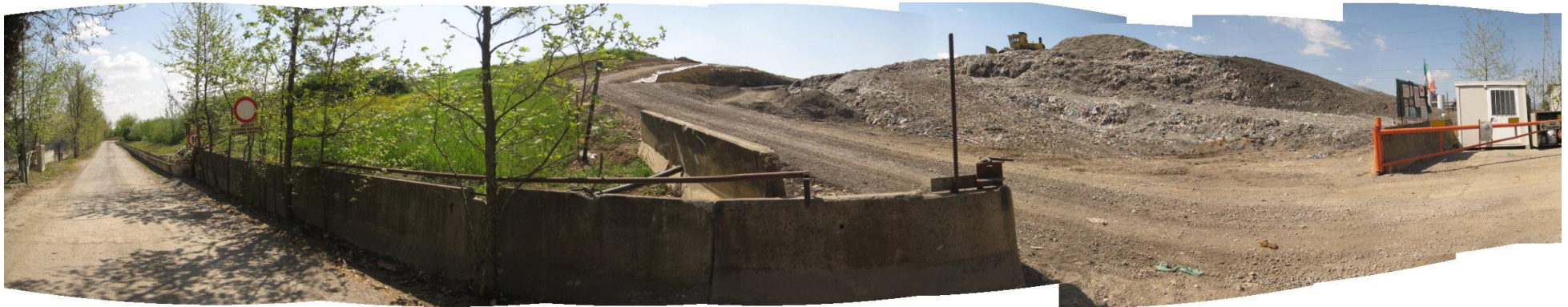
Fotografia 1. Vista ingresso discarica – Lotto 5A