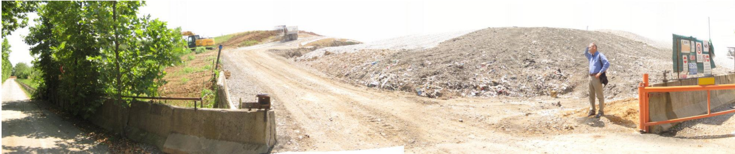
Fotografia 1. Vista ingresso discarica – Lotto 5A