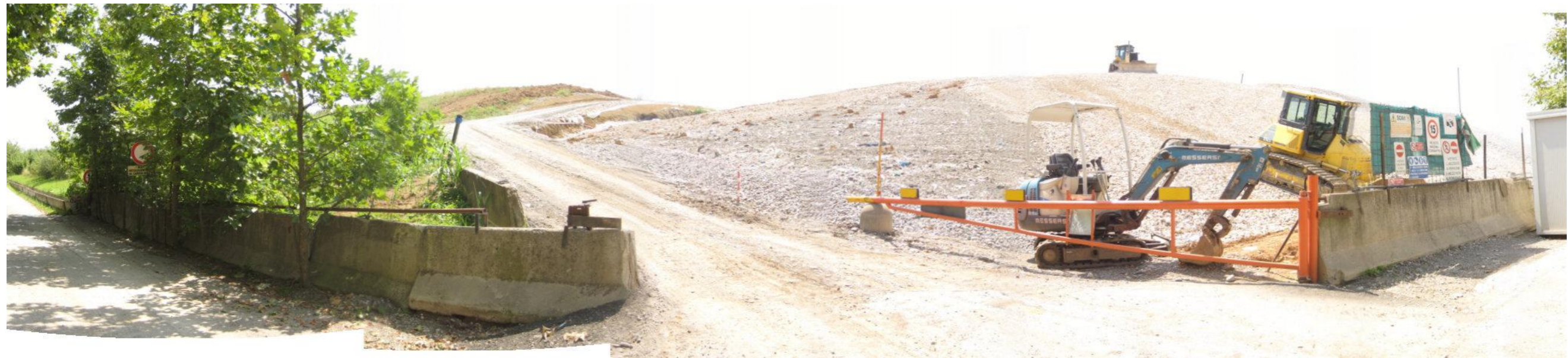
Fotografia 1. Vista ingresso discarica – Lotto 5A