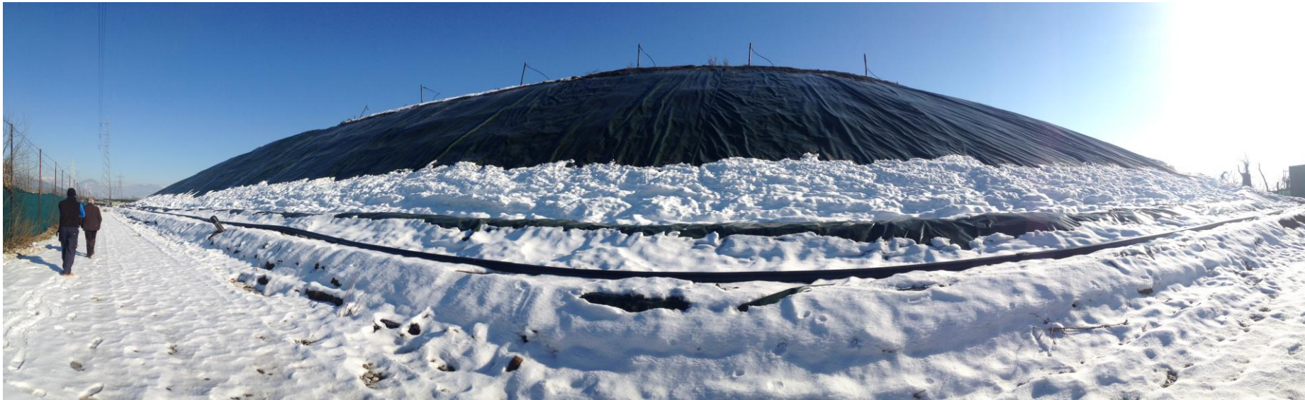
Fotografia 2: Telo di copertura della scarpata Nord