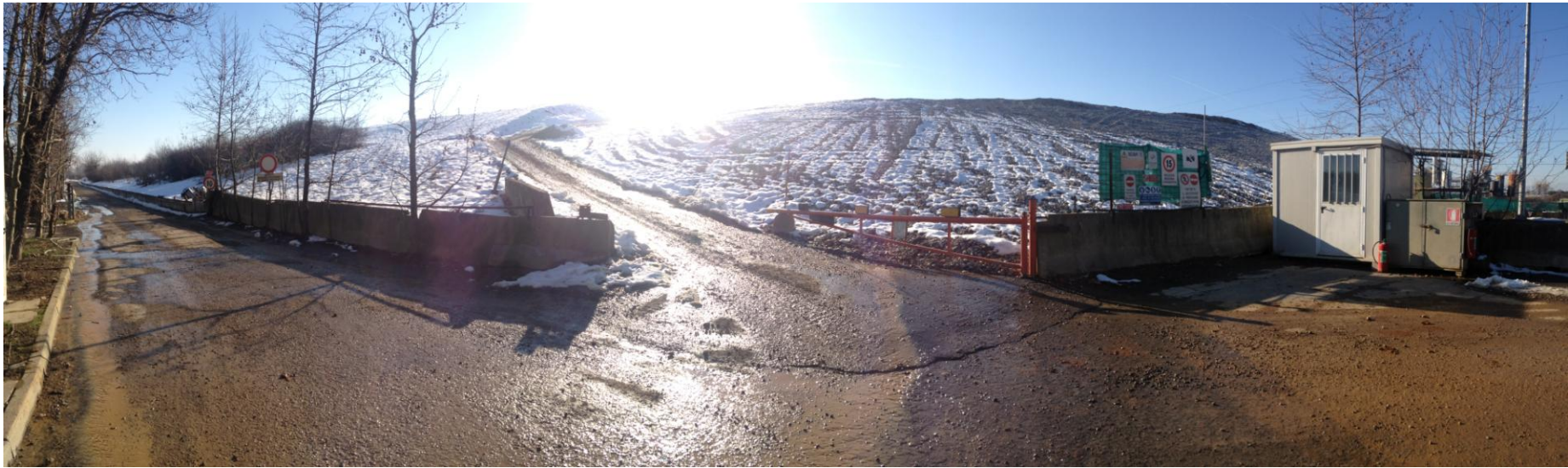
Fotografia 1: Scarpata Est lato ingresso discarica